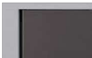
Powłoka odporna na promieniowanie UV

Elementy elektroniczne i mechaniczne dobrze zabezpieczone przed czynnikami zewnętrznymi