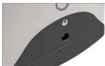
Aluminiowy korpus obudowy