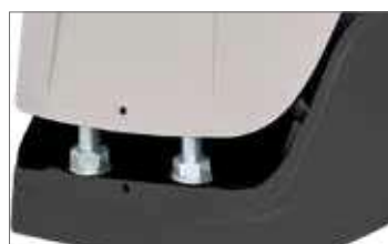
Ukryte mocowanie obudowy zewnętrznej

Elementy elektroniczne i mechaniczne dobrze zabezpieczone przed czynnikami zewnętrznymi