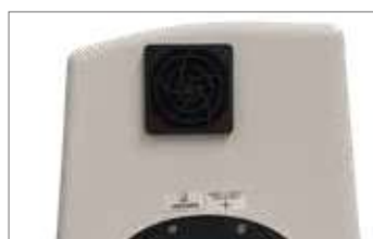
Wentylator chłodzący (SC202MHD) dla większej intensywności pracy