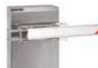
Uchwyt mocowania ramienia owalnego wychylnego - (INOX)

Nie ma możliwości zamontowania "firanki", podpory ruchomej czy też podpory stałej w przypadku okrągłych ramion wychylnych.