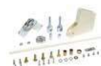
Zestaw łamania do ramienia szlabanu - maks. wysokość pomieszczenia 3 m (tylko do standard, ramion prostokątnych)