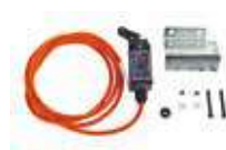
Czujnik wychylenia ramienia owalnego