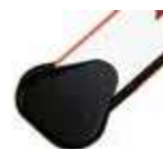
Mocowania do ramion prostokątnych lub owalnych ♦

Ramiona prostokątne posiadają gumowe zabezpieczenia przeciwuderzeniowe. Ze względu na właściwe wyważenie ramienia, aktywne zabezpieczenia nie mogą być instalowane na ramieniu.