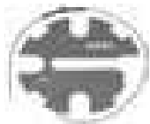
Grzałka JH275 do słupka automatycznego