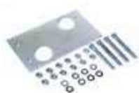
Opcjonalna podstawa montażowa