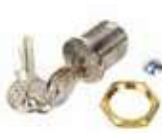
Wkładka zamka rozblokowania z kluczem spersonalizowanym (od nr 1 do nr 10)