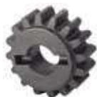
Koło zębate Z16