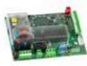
Centrala sterująca E844 3PH Więcej → strona 133