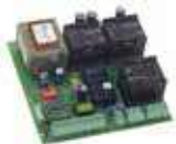
Centrala sterująca 844T + Więcej → strona 133