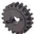
Koło zębate Z20