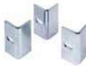
Opakowanie z elementami mocującymi do listwy zębatej