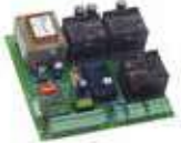
Centrala sterująca 844T Więcej → strona 133