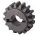
Koło zębate Z16 moduł 6