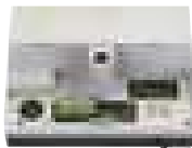
Wbudowana centrala sterująca E1000 Więcej → strona 133