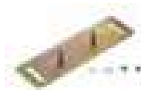
Płyta montażowa do montażu w trzech płaszczyznach