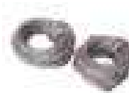
Przedłużenie do szybkiego odblokowania