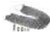
Łańcuch z zapinką