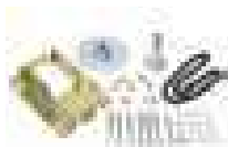
Zestaw przekładni łańcuchowej, przełożenie 1:2,0