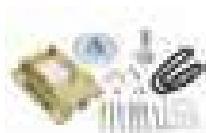
Zestaw przekładni łańcuchowej, przełożenie 1:1,5