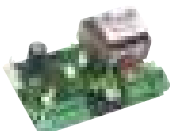
Wbudowana centrala sterująca 540 BPR Więcej → strona 133