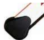
Mocowania do ramion prostokątnych lub owalnych ♦

Ramiona prostokątne posiadają gumowe zabezpieczenia przeciwuderzeniowe. Ze względu na właściwe wyważenie ramienia, aktywne zabezpieczenia nie mogą być instalowane na ramieniu.