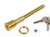
Mechanizm odblokowujący z kluczem