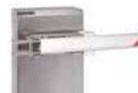
Uchwyt mocowania ramienia owalnego wychylnego - (INOX)

Nie ma możliwości instalacji fartucha, podpórki pod ramię lub podpory stałej na nowych ramionach wychylnych.