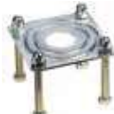
Podstawa fundamentowa do podpory stałej