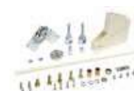
Zestaw łamania do ramienia szlabanu - maks. wysokość pomieszczenia 3 m (tylko do standard. ramion prostokątnych)